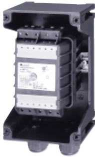
Защитный автомат электродвигателей GHG 635