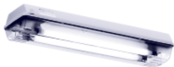
nLLK 98018/18 (2 x 18 Вт)